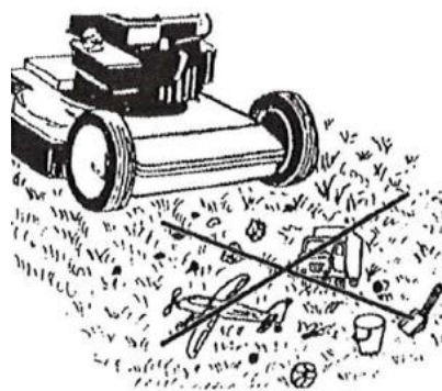
1 Pav. vejos paruošimas žolės pjovimui.

47. Prieš pradėdant dirbti žoliapjove, patikrinti: