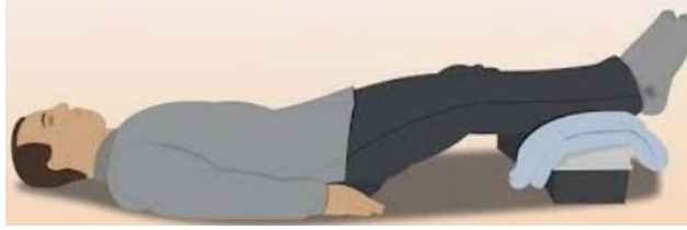
5 pav. Apalpusio žmogaus paguldymas tinkama padėtimi.