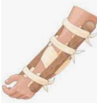
4 pav. Lūžusio kaulo sutvirtinimas.

28. Lūžus kaului ar išnirus galūnei pagrindinis pirmosios pagalbos uždavinys yra skaudamai galūnei užtikrinti ramią ir patogią padėtį. Tai pasiekama, kai galūnė visai nejuda. Šito reikia laikytis ne tik skausmui pašalinti, bet ir apsaugoti gretimus audinius nuo kitų papildomų sužalojimų, kurių gali atsirasti kaului iš vidaus pažeidus audinius. Lūžimo ar išnirimo atveju galūnę sutvirtinti įtvaru, faneros plokšte, lazda kartonu ar kitu tam tinkamu daiktu.