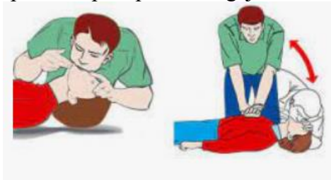
7 pav. Dirbtinis kvėpavimas.

63. Dirbtinis kvėpavimas daromas tik tuo atveju, jei nukentėjusysis nekvėpuoja arba kvėpuoja netaisyklingai, o taip pat, jei kvėpavimas palaipsniui blogėja.