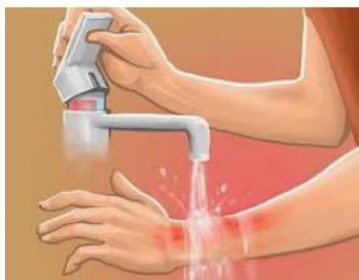
3 pav. Nudegusios vietos šaldymas po tekančio vandens srove.

22.1.3. nuimti drabužius nuo nudegusios vietos ir ją sutvarstyti, jeigu rūbai prilipę prie odos jų neplėšti, o ant jų uždėti sterilų tvarstį ir vežti nukentėjusį į gydymo įstaigą. Veido tvarstyti negalima;