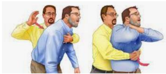
6 pav. Veiksmai esant užspringimo atvejui.

51.2. visiško nepraeinamumo atveju – jei žmogus sąmoningas – suduoti 5 smūgius į nugarą ir atlikti 5 pilvo paspaudimus.