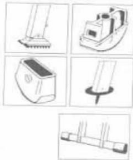
2 pav. Kopėčių apatinės dalies apsauga nuo kritimo.