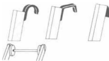
3 pav. Kopėčių viršutinės dalies apsauga nuo kritimo.